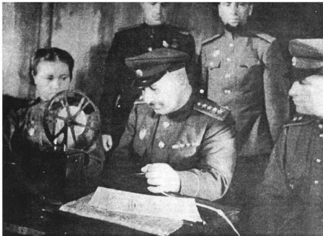
Հայրենական մեծ պատերազմ. 1-ին Մերձբալթյան ռազմաճակատի շտաբում, հեռատիպի մաս («Баграмян. Фотоальбом»)