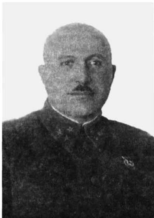
Գեներալ-լեյտենանտ Հովհաննես Բաղրամյան 1942 թ.

ճակատ մեկնելու՝ ռուս պինվորների հետ թուրք դահիճների դեմ կռվելու համար: «Գրոված այդ պգայմունքներից, — իր հուշերում գրում է Բաղրամյանը, — և հաղթահարելով ծնողներիս դիմադրությունը՝ 1915 թ. հոկտեմբերի 9-ին ես կամավոր մտա ռուսական բանակի շարքե-