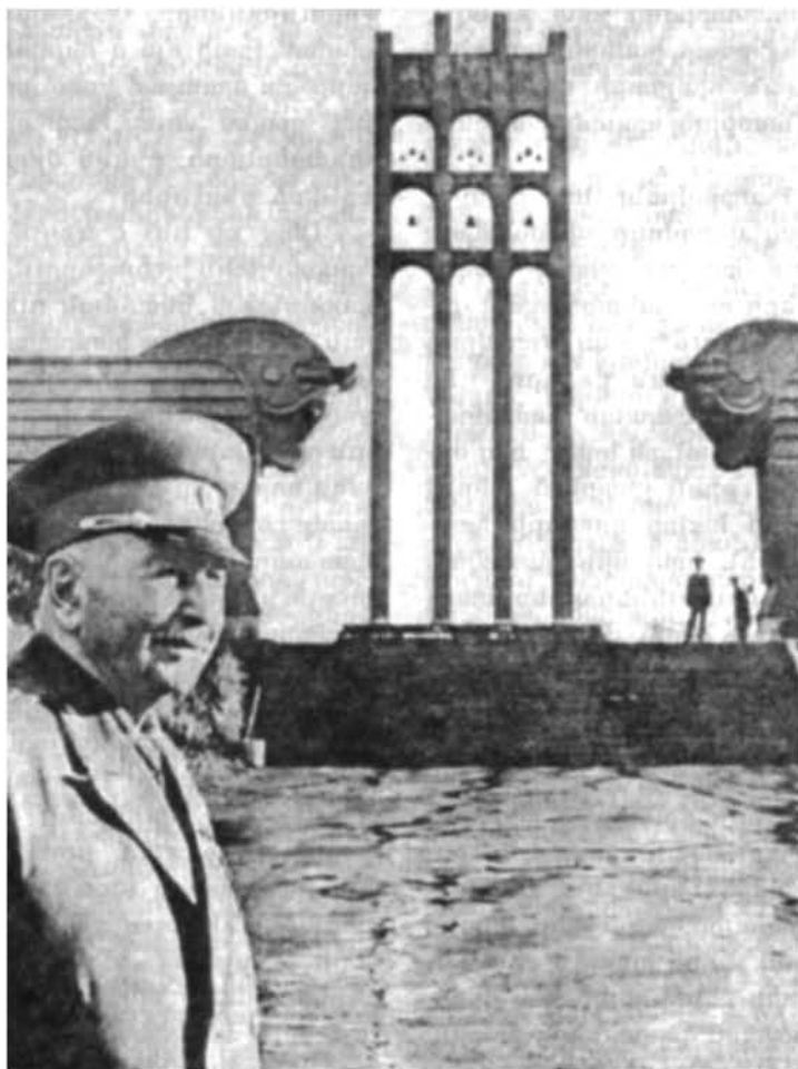
Սարդարապատի ճակատամարտի մասնակից մարշալ Բաղրամյանը Սարդարապատի հուշահամալիրում

անձնական հատկությունները: Այս հիանալի փորավարի անսովոր ռազմական տաղանդը և հայ ժողովրդի համար ահեղ 1918 թվականին հայրենիքին մատուցած նրա մեծ ռազմական ծառայությո-