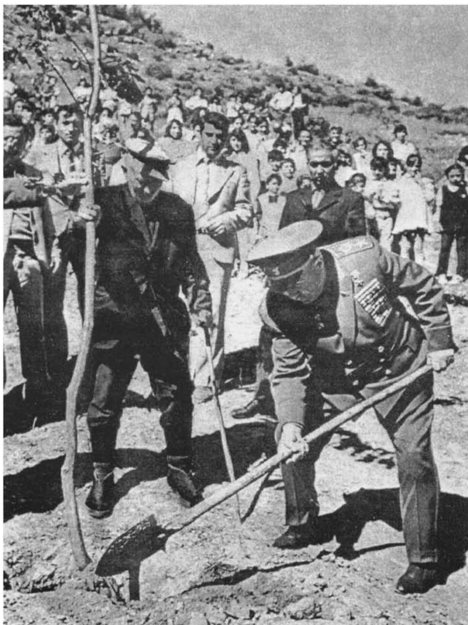
Մարշալ Հովհաննես Բաղրամյանը, շարունակելով դարավոր ավանդույթը, կողնի ծառ է տնկում մեծ պորավար Վարդան Մամիկոնյանի ընկած ծառի տեղում. Իջևան, 1976 («Баграмян. Фотоальбом»)