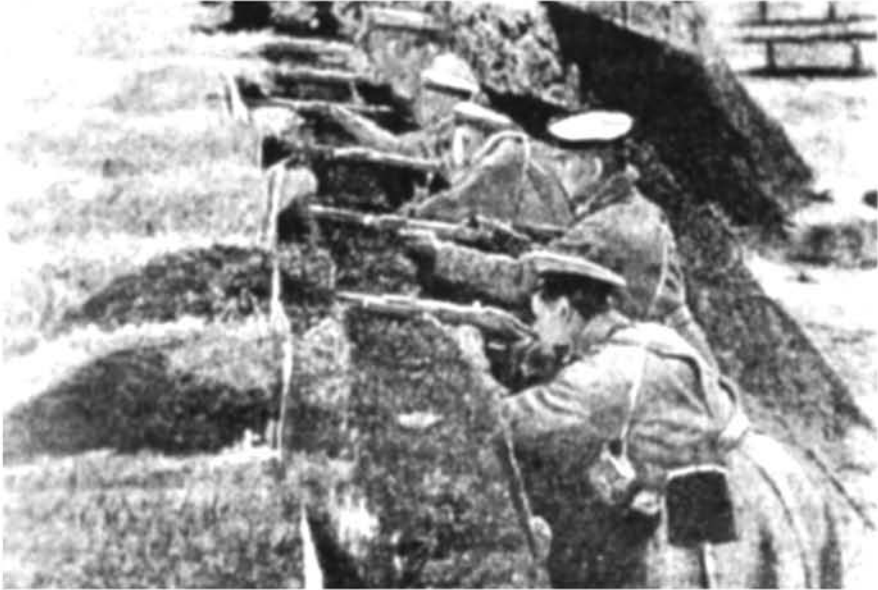
Առաջին համաշխարհային պատերազմ. ռուս փնվորները կրակ են վարում խրամատից («Великая война в образах и рисунках». Изд. Мамонтова, 1916 արմից. Հայաստանում տպագրվում է առաջին անգամ)

խավոր դրդապատճառները: Այդ դեպքում նա որոշակի ձևով կապմուն է ժողովրդի բնավորության մի մաս և կապի