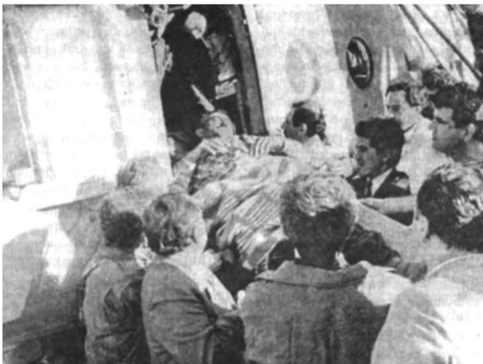
Ադրբեջանից բռնագաղթած հայերին ընդունում են Երևանում (լուսանկարը՝ «Արմենպրես» գործակալության, 1989 թ.)

նանկարում որևէ պրոբլեմի առաջացում (տես աղյուսակ 1-ը):