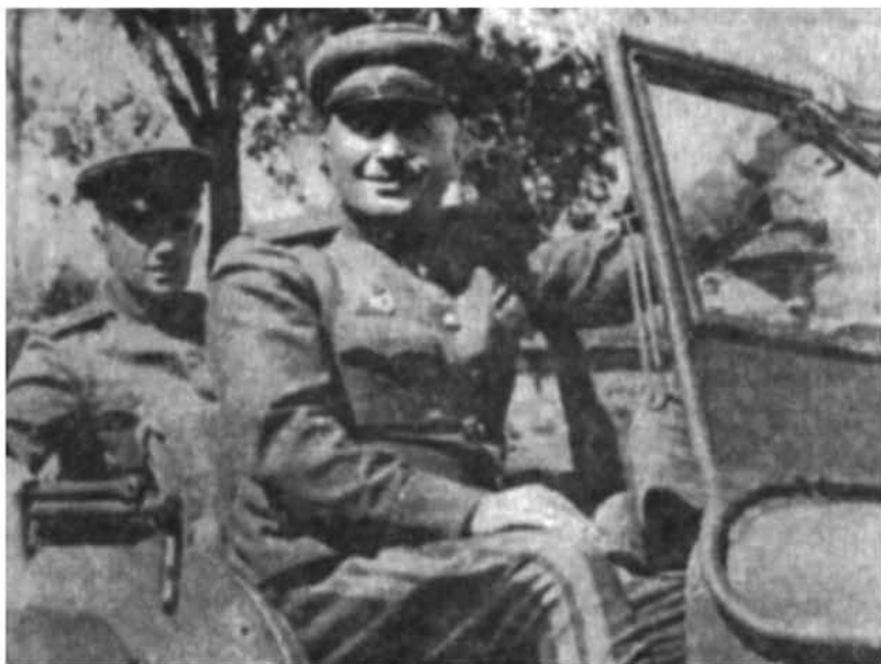
1-ին Մերձբալթյան ռազմաճակատի հրամանատար բանակի գեներալ Հ. Բաղրամյան

Պատերազմի ավարտական շրջանում Բաղրամյանի պորավարական գործունեությունն անցավ Խորհրդային Միության մարշալ Ա. Մ. Վասիլևսկու հետ սերտ շփման ու մարտական համագործակցության մեջ: Խորհրդային պինված ուժերի գլխավոր շտաբի պետը՝ որպես Գերագույն գլխավոր հրամանատարության ռազմականի ներկայացուցիչ, բաղվում էր բելոռուսական ուղղության