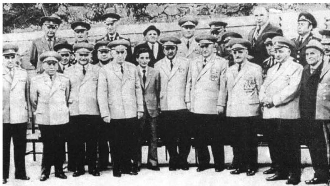
Մարշալ Հովհաննես Բաղրամյանը Հայրենական պատերազմի վետերան հայ զինորդների հետ