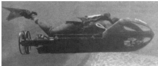
Նկ. 4. Ամերիկյան PDP ստորջրյա քարշակ

Փոխադրամիջոցներ: Մեծ հեռավորությունների վրա հակառակորդի մերձափնյա տարածքում նախապատրաստական աշխատանքներ կատարելու համար մարտական