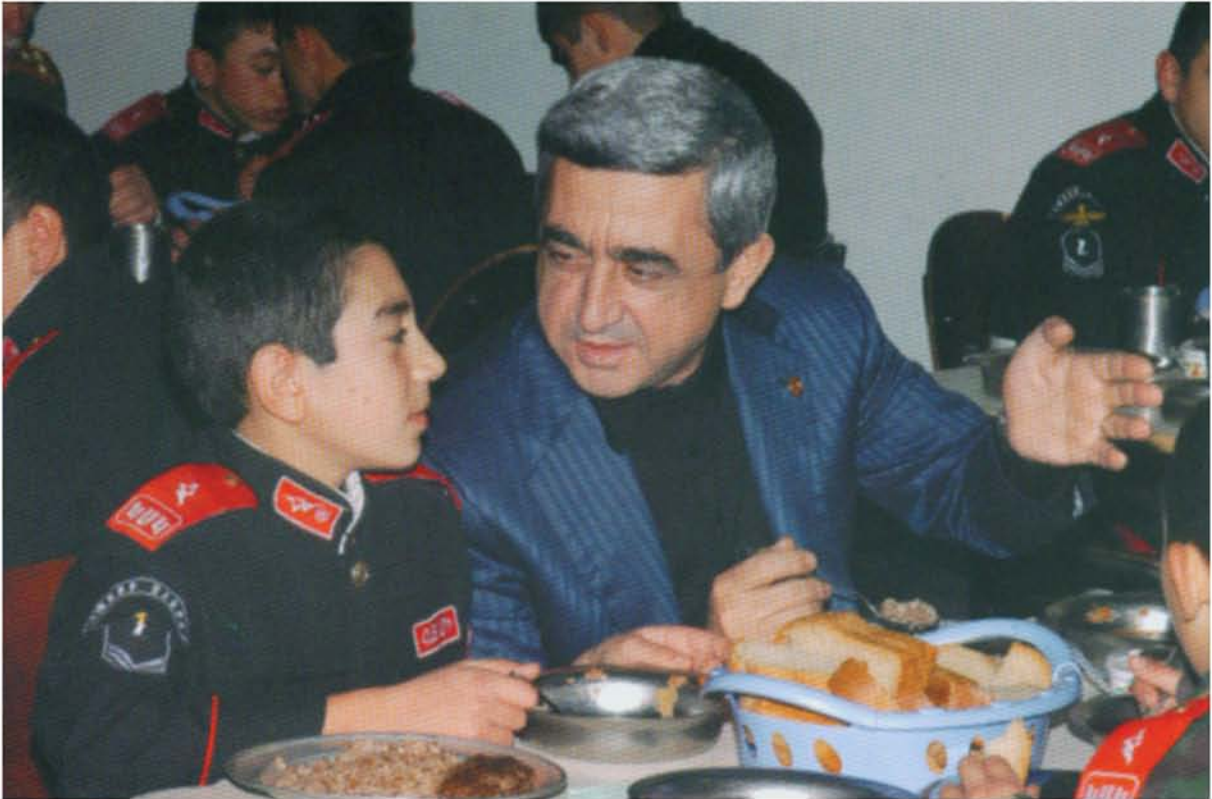
Հայաստանի Հանրապետության Վարչապետ Ս. Սարգսյանը «Փոքր Միեր» (կաղետական) կրթահամալիրում.