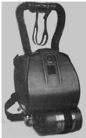
Նկ. 1. Ռեգեներատիվ տիպի LAR VII մեկուսացնող շնչառական սարք (ԱՄՆ)

Մարտական լողորդների հանդերձանքի, սպառազինության, սարքավորանքի և փոխադրամիջոցների մշակման ու կատարելագործման ուղղությամբ աշխատանքներ են կատարվում շատ երկրներում: Հանդերձանքը համապիտանի է և կիրառվում է մի շարք ոլորտներում: Իսկ սպառազինությունը և հատուկ սարքավորանքը նախատեսված են հատուկ այդ ստորաբաժանումների համար՝ նրանց գործունեության բոլոր առանձնահատկությունների հաշվառմամբ: