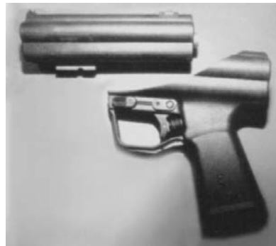
Նկ. 3. ԸՄՊ-11 ձեռնարկության ատրճանակը

Արտասահմանյան մասնագետների կարծիքով՝ Պ-11-ը հուսալի և արդյունավետ զենք է: