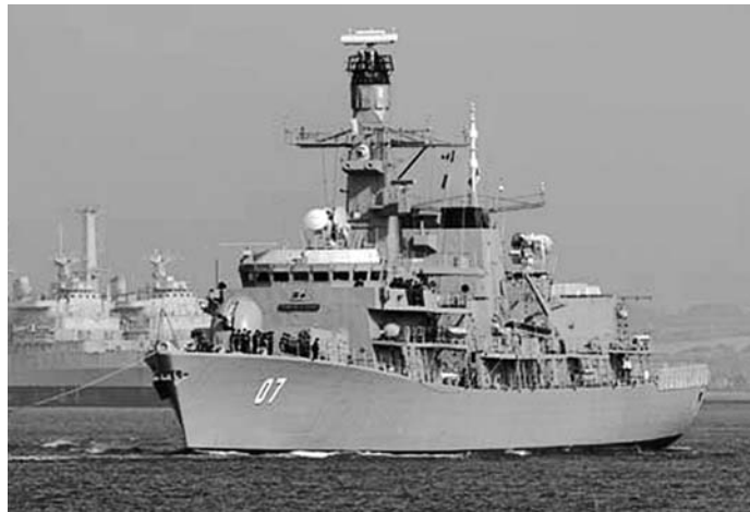
«Ծովակալ Լինչ» պահականավը

Հեռնան Կույումջյանը ռազմածովային ճարտարագետ է: Վինյա դել Մարի ռազմածովային սպառազինության դպրոցում ծառայելով որպես գլխավոր հրետանային հրահանգիչ՝ հաճախել է Թագավորական ռազմածովային նավատորմի հաստատություններում և Հյուսիսային Իռլանդիայի, Անգլիայի, Ֆրանսիայի ու Նիդեռլանդների