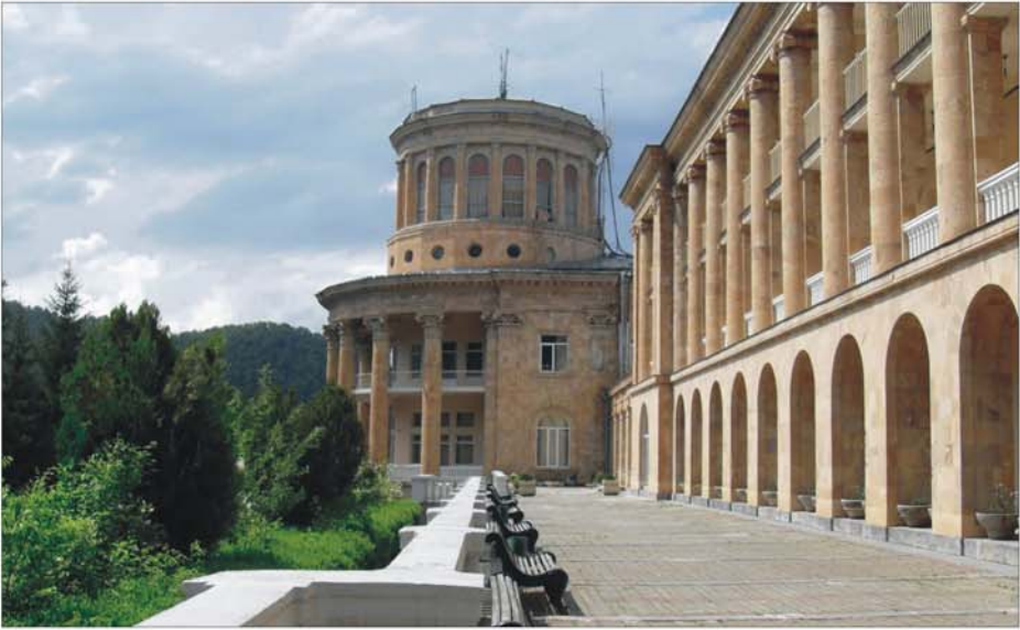
ՀՀ ՊՆ «Լեռնային Հայաստան» հանգստյան տուն – առողջարանը Դիլիջանում