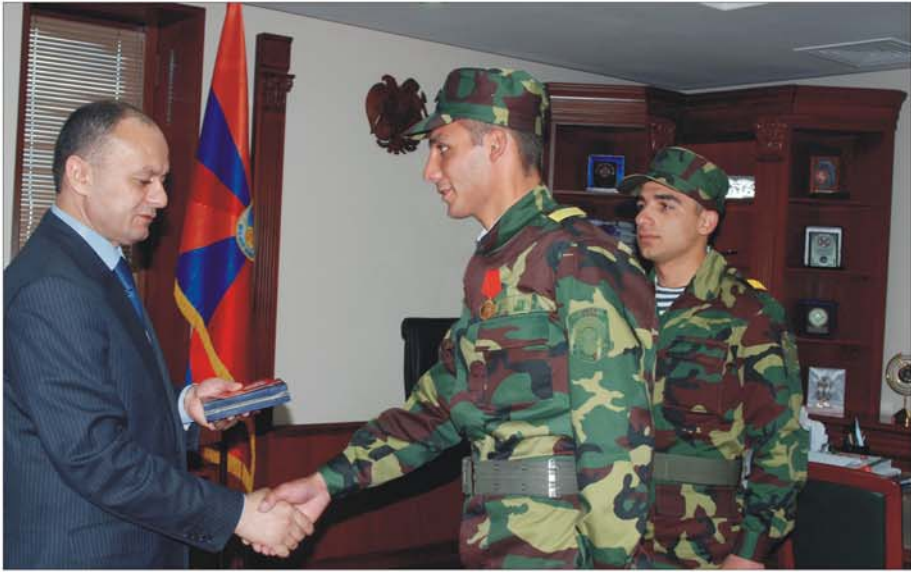
ՀՀ Պաշտպանության նախարար Սեյրան Օհանյանը պարտադիր ժամկետային զինծառայողներին ծառայողական պարտականությունները կատարելիս ցուցաբերած խիզախության համար պարգևատրում է գերատեսչական մեդալներով. Երևան, 2009 թ. հունիսի 1