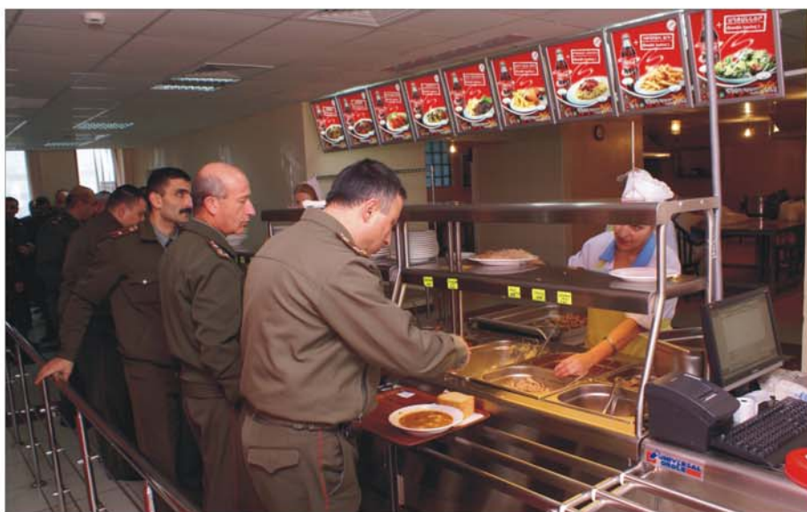
ՀՀ պաշտպանության նախարարության նորակառույց վարչական համալիրի ճաշարանում ընդմիջման ժամանակ