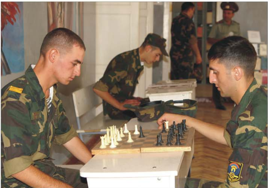
Ջինժառայողների հանգստի կազմակերպում ՀՀ ՋՈՒ-ի զորամասերից մեկում