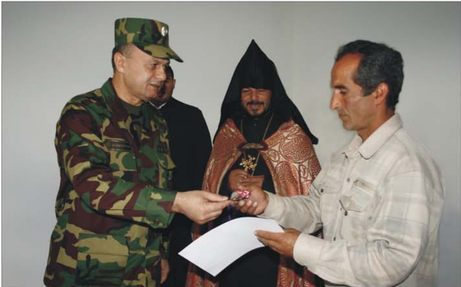
Գրվազ ՀՀ Պաշտպանության նախարար Սեյրան Օհանյանի և Հանահայկական միջազգային երիտասարդական կենտրոնի նախաձեռնությամբ Արցախյան ազատամարտի մասնակցի համար կառուցված առանձնատան բացման արարողությունից: Կենտրոնում՝ ՀՀ ՁՈՒ-ի հոգևոր առաջնորդ Տեր Վրթանես եպիսկոպոս Աբրահամյանը. Տավուշի մարզ, 2009 թ. հունիսի 28