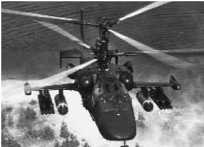
Կա-52 մարտական հարվածային ուղղափոխ

Կա-52 («Ալիգատոր») մարտական հարվածային ուղղափոխ: Ռուսաստանյան այս ուղղափոխը բանակային ավիացիայի հրամանատարական մեքենա է, որը կատարում է տեղանքի հետախուզում, նշանացուցում և մարտական ուղղափոխների խմբի գործողությունների համադասում: Մեքենան ունակ է խոցելու հակառակորդի զրահապատ տեխնիկան, կենդանի ուժը և օդային նշանակետերը: Կա-52-ը Կա-50 «Չոռնայա ակուլա» ուղղափոխի հիմքի վրա ստեղծված, կատարելագործված մոդել է: Կոնստրուկտորներին հաջողվել է ապահովել, որ մեկ տոննայով ծանրացած ուղղափոխը չկորցնի Կա-50-ի բացառիկ մարտական հատկությունները: Երկտեղանի Կա-52-ը նախորդի համեմատությ-