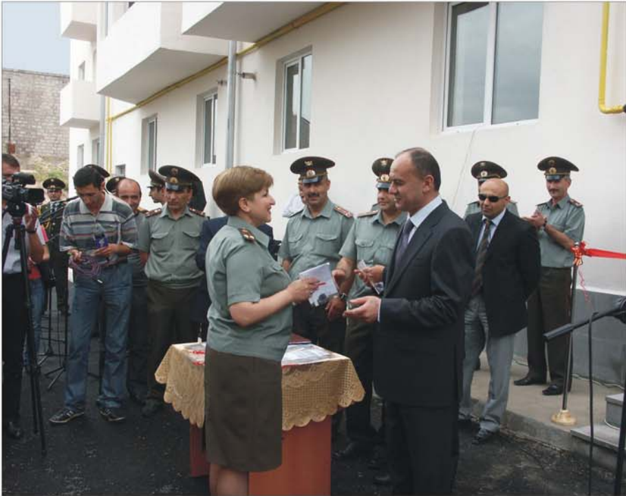
ՀՀ Պաշտպանության նախարար Սեյրան Օհանյանը քնակարաններ է հանձնում զինծառայողներին. Երևան, 2009 թ. հունիսի 19