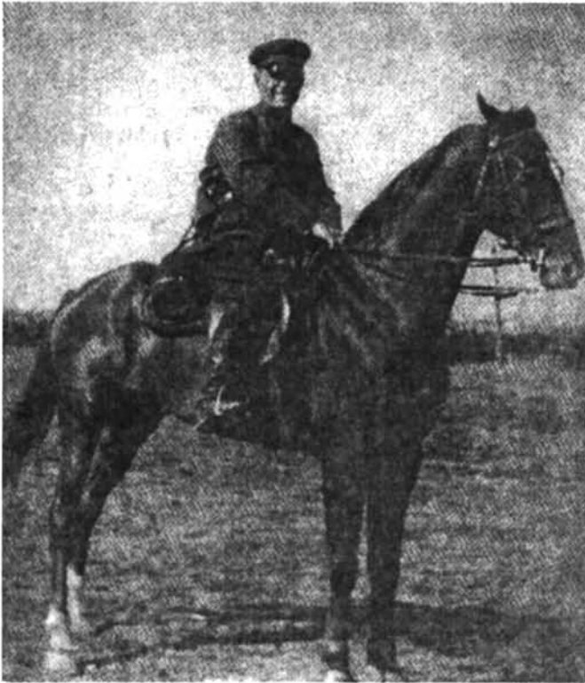
Հեծյալ գնդի հրամանատար Գ. Կ. Ժուկով (Գ. Կ. Жуков. «Воспоминания и размышления», М., АПН, 1971 զրքից)

նայում էի նրան: Ցանկանում էի թափանցել նրա հոգեկան աշխարհը, հասկանալ նրան որպես մարդու և հրամանատարի» 1 :