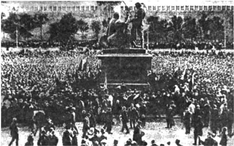
Բնակչության ցույցը պատերազմի հայտարարման կազմակերպմամբ. Մոսկվա, Կարմիր հրապարակ, 1914 թ. օգոստոս («Великая война в образах и рисунках». Изд. Мамонтова, 1916 պրոմից. Հայաստանում տպագրվում է առաջին անգամ)

որևէ ազգարակ կամ այդ տեսակի մի որևէ պատասպարան կազմում է դիրքի մի մաս, թերևս պետք չի լինում այդ տեղական առարկան վրադեցնել մի առանձին պորամատով, քանի որ այն արդեն վրադեցրած է լինում կամավորների մի մեծաթիվ կայացոր»: