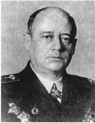
Հովհաննես Իսակով, ԽՍՀՄ ծովակալ