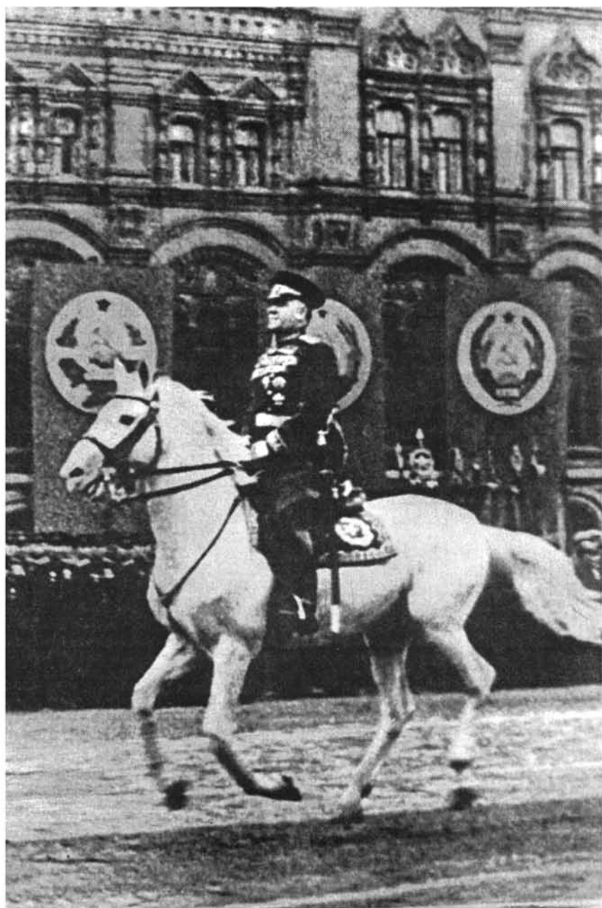
Գ. Կ. Ժուկովը հաղթանակի Վորահանդեսում. Մոսկվա, Կարմիր հրապարակ, 1945 թ. հունիսի 24