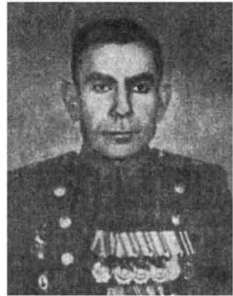
Նվեր Սաֆարյան, գեներալ-մայոր