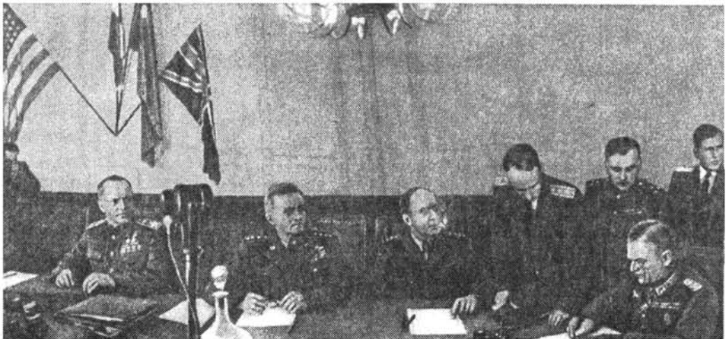
Գերմանիայի կապիտուլյացման ակտի ստորագրումը. ձախից առաջինը՝ Գ. Վ. ժուկով