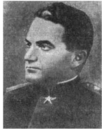
Արմենակ Խանփերյանց (Ս. Ա. Խուդյակով), ավիացիայի մարշալ