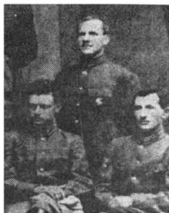
Աջից՝ Հ. Բ. Բաղրամյան, կենտրոնում՝ Գ. Կ. Ժուկով (1925 թ.)