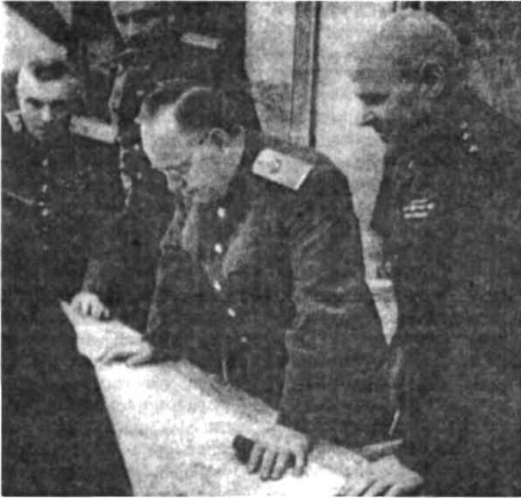
Ձախից այժ՝ գեներալ Վ. Կազակով, գեներալ Գ. Օրյոլ, 1-ին Բելոռուսական ռազմաճակատի հրամանատար մարշալ Գ. ժուկով և ռազմական խորհրդի անդամ գեներալ Կ. Տելեգին. 1945 թ. ապրիլի 21

(Г. К. Жуков. «Воспоминания и размышления», М., АПН, 1971 գրքից)