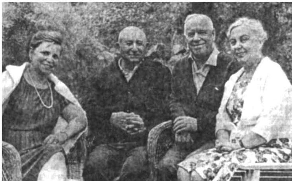
Ժուկովը և Բաղրամյանն իրենց կանանց հետ ամստանոցում (И. Х. Баграмян. Фотоальбом. Е., «Айастан», 1987 գրքիս)

քի արգասիքը եղավ այն սարսափելի կամայականության, կեղծիքի և ապօրինության նրա կողմից ստեղծված լայն էպիկական պատկերը, որոնց պոռ դարձավ արդիականության մեծ պորավարը: Կարպովի գրական խճանկարը, որը կըրում է «Մարշալ Ժուկով. շնորհագրություն» վերնագիրը 4 , համուզիչ կերպով ապացույցում է, որ այդ հետապնդումն սկսվել է բարձր մակարդակներում: Վերևից եկող հրամաններով Ժուկովի շուրջ ստեղծվում էր բարդ ինտրիգների մթնոլորտ: Ինչպես նշում է գրողը, մարշալի հետպատերազմյան կյանքի 28 տարիներից 25-ը նա եղել է շնորհագրված, և այդ տարիներին մահն ավելի հաճախ էր սպառնում նրան, քան ռազմաճակատում: Եվ առավել ցավալին այն է, որ Ժուկովի այս հետապնդման կազմակերպման գործում ջանք չէին խնայում նաև որոշ բարձրաստիճան պորապետներ: