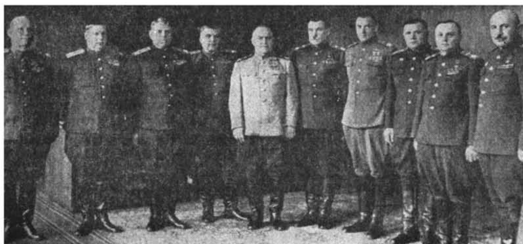
Ռազմաճակատների հրամանատարները, կենտրոնում՝ Գ. Կ. Ժուկով, աջից առաջինը՝ Հ. Բ. Բաղրամյան