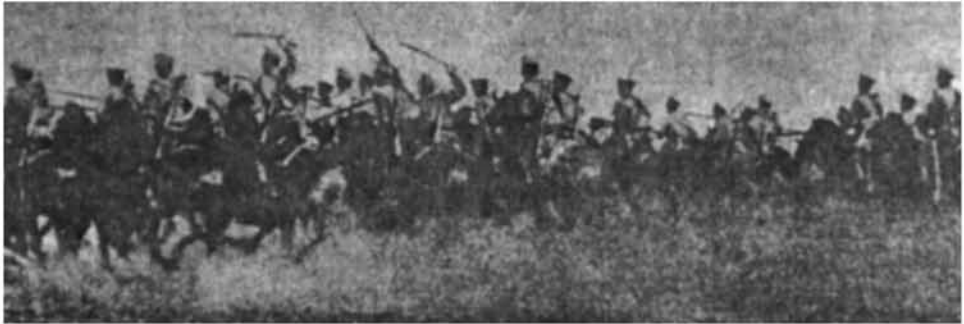
Առաջին համաշխարհային պատերազմ. կավակների գործը՝ «լավա» («Великая война в образах и рисунках». Изд. Мамонтова, 1916 այբումից. Հայաստանում տպագրվում է առաջին անգամ)

1) երբ այն կապված չէ ոչ մի ներքին ջանքի հետ, այսինքն՝ ռեֆլեկտոր, կամ ոչ կամային,