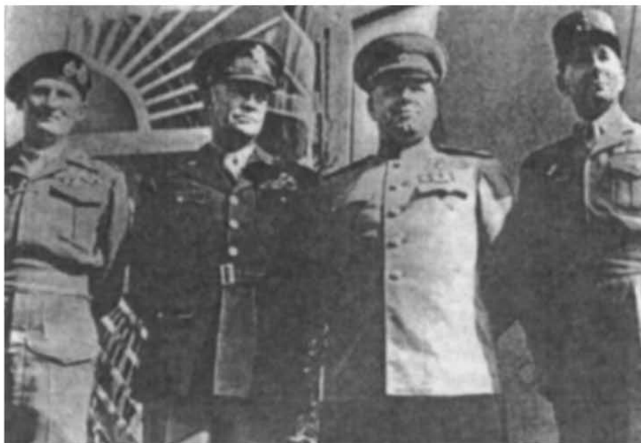
Գաշնակից զորքերի հրամանատարները. ձախից աջ՝ ֆելդմարշալ Բ. Մոնտգոմերի, գեներալ Գ. Էյզենհաուեր, մարշալ Գ. ժուկով, գեներալ ժ. Գելատր դը Տասինյի (Գ. Կ. Жуков. «Воспоминания и размышления», М., АПН, 1971 զրրից)

նամու հնարավոր հարվածը կանխելու ուղղությամբ Բաղրամյանի առաջարկությունն ընդունվեց: Հետագա իրադարձությունների ընթացքը հաստատեց դրա արդարացիությունը 20 :