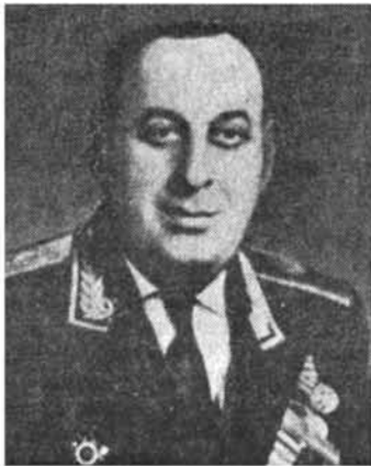
Հայկ Մարտիրոսյան, գեներալ-մայոր