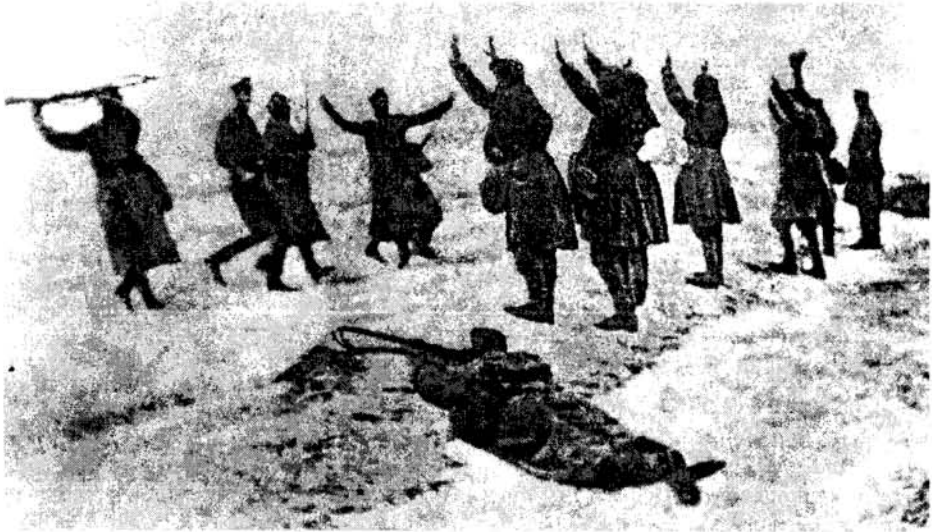
Առաջին համաշխարհային պատերազմ. ավտորիայի փնտրվող գեղի են հանձնվում ռուսներին («Великая война в образах и рисунках». Изд. Мамонтова, 1916 արտոմպ.) Հայաստանում տպագրվում է առաջին անգամ)

դու թյուններում, որոնք են այն ամենը, ինչ վերաբերում է վտանգի խուսափելուն: Դրանով է բացատրվում փախուստի դիմելու այդ հանկարծակի անհաղթահարելի ձգտումը: Այդ ձգտումն այնքան զորեղ է լինում, որ ամենաբաց վիճակում կարող են ենթարկվել խուճա-