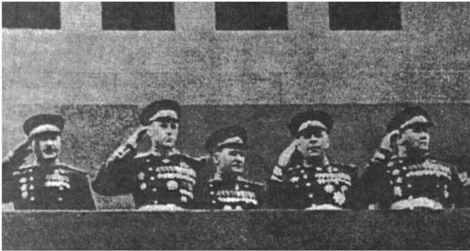
Մարշալ Հ. Բ. Բաղրամյանը Հաղթանակի պորահանդեսում (առաջինը ձախից)։ Մոսկվա, 1945 թ. հունիսի 24 Маршал О. Х. Баграмян на Параде Победы (первый слева). Москва, 24 июня 1945 г. Marshal H. Ch. Bagramyan at the Victory Parade (first from left). Moscow, 1945, June 24

րամյանը: Երկու տարվա արդյունավետ աշխատանքով պինված ուժերի բարձրագույն պինվորական կադրերի այդ դարբնոցը հասավ նոր բարձրության... Նրա ղեկավարությամբ աշխատելը հեշտ էր, — գրում է Ռոտմիստրովը, — նա երբեք նախաձեռնությունը չէր կաշկանդում, իր կարծիքը չէր պարտադրում և համոզելը