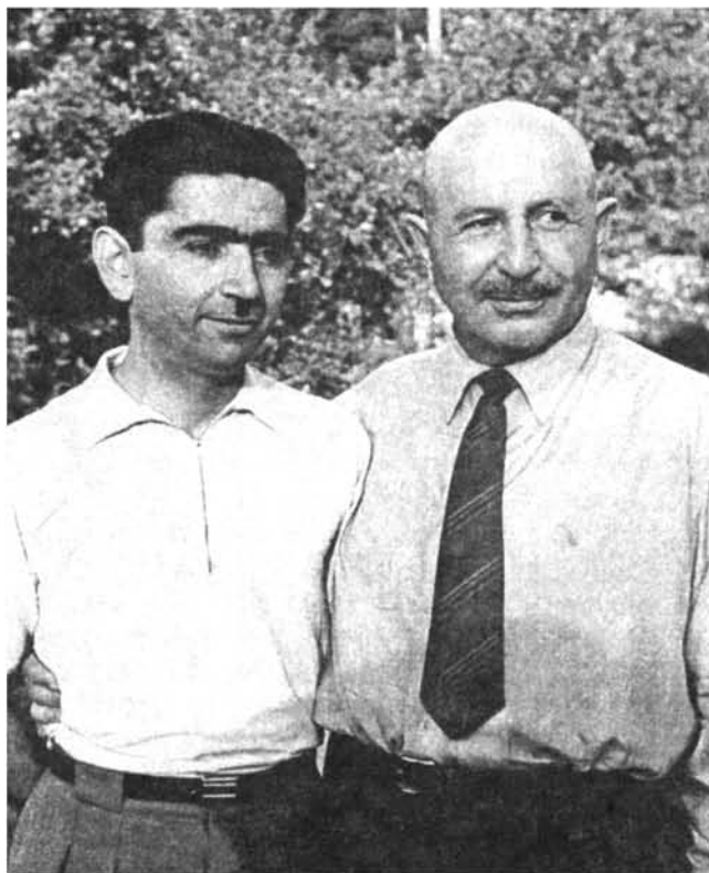
Մարշալը եղբոր որդի Հրանտ Բաղրամյանի հետ աստառանոցում, 1959 թ.: (հեղինակի ընտանեկան արխիվից, հրատարակվում է առաջին անգամ) Маршал с племянником Грантом Баграмяном на даче, 1959 г. (из семейного архива автора, публикуется впервые)

Чардахлу. Баграмян выражал свое удовлетворение тем, что односельчане подобными преданиями поддерживали в молодежи чувство патриотизма. Издревле здесь содержали не