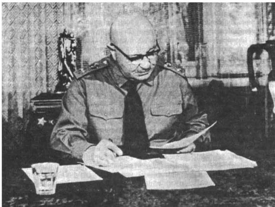
Աշխատանքային սեղանի մոտ За рабочим столом At the working table

տերավմի վերաբերյալ ակտիվ գիտահետազոտական աշխատանքի հետ: Գրում էր հուշեր և գիտական հոդվածներ, ելույթներ և զեկուցումներ էր ունենում ռազմագիտական կոնֆերանսներում: Նա մեծ ներդրում ունեցավ Հայրենական մեծ պատերազմի համառոտ պատմության մենհատոուակի ստեղծման