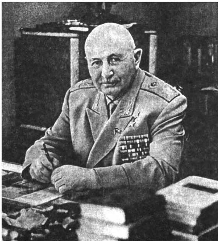
Ախառասնկալում. 1976 թ. В рабочем кабинете, 1976 г. In the office, 1976

«Несомненно, одаренным полководцем является И. Х. Баграмян. Он обладает и командным и штабным опытом, что помогает ему успешно решать как вопросы руководства войсками, так и разработки планов