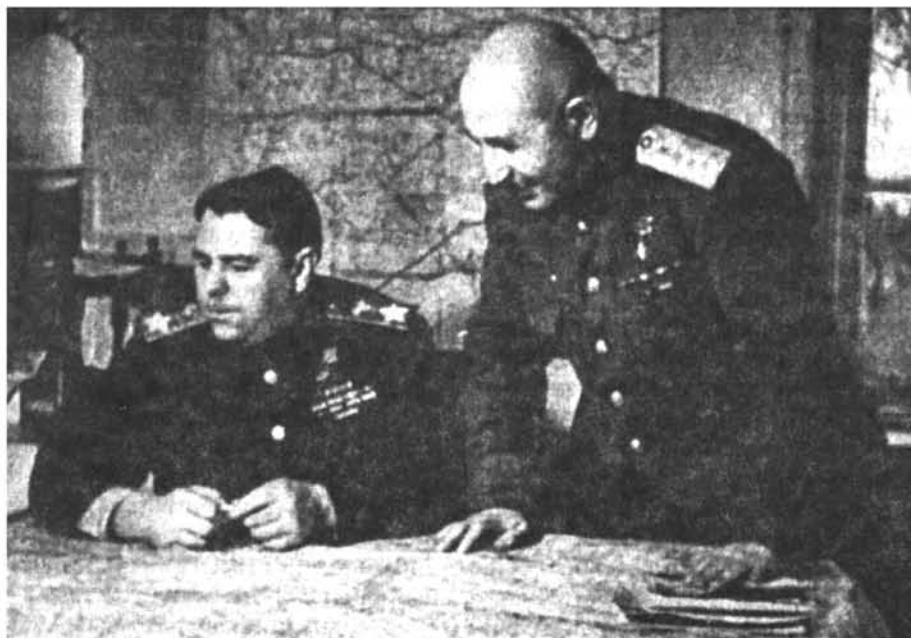
1-ին Սևրճրախյան ռազմաճակատի շտաբում մարշալ Վասիլևսկու հետ. 1944 թ. В штабе 1-го Прибалтийского фронта с маршалом Василевским, 1944 г. In the 1-st Baltic Front H. Q. with marshal Vasilevskiy, 1944

Несмотря на героическое сопротивление армянских войск, 60-тысячное турецкое войско продолжало наступление и, заняв Карс и Александрополь, двигалось в направлении Каракилис—Ереван.