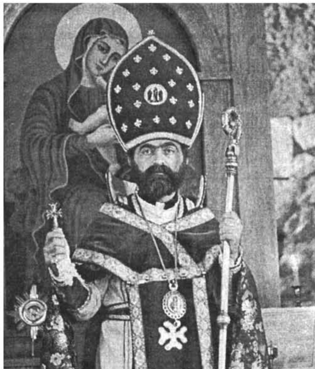
Ղարաբաղի թեմի Առաջնորդ արքեպիսկոպոս Պարգև Մարտիրոսյան, Ղարաբաղ, Ամարաս, 1990 թ. Глава Карабахской епархии архиепископ Паргев Мартиросян, Карабах, Амарас, 1990 г. Head of the Karabagh eparchy archbishop Pargev Martirosyan, Karabagh, Amaras, 1990

շատախտակներում նկատում էր հայրենակիցների անուններ: Ծննդավայրի հետ կապված ամեն մի հիշատակություն, հայրենակիցների խիզախության