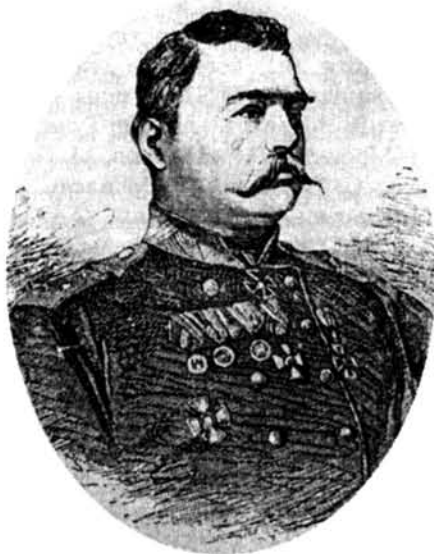
Գեներալ-լեյտենանտ Ա. Տեր-Գուկասով (1819—1881) (Հայաստանի պատմության թանգարան, N 1265)

Баграмяна, был благосклонно принят Сталиным, и выдвинул свой вариант. Командующие Брянским и Западными фронтами попробовали опровергнуть аргументацию Баграмяна.