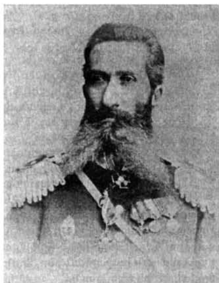
Գեներալ-մայոր Ջհան Մարգարյան Генерал-майор Джаан Маргарян Jahan Markaryan

պետ չարդախլուի Գրիգոր Կարակոպովը: Չենք կարող չնշել նաև «Սուխոյի» ՀԿԲ գլխավոր կոնստրուկտոր չարդախլուի Ռուան Մարտիրոսովին, որը «21-րդ դարի ռազմական ինքաթիռի» համբավ ձեռք բերած ՍՈՒ-34 հարվածային