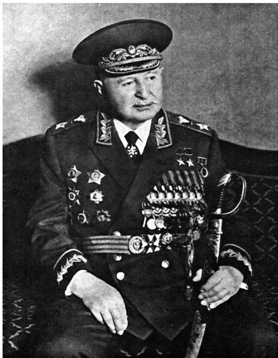
Խորհրդային Միության կրկնակի հերոս, Խորհրդային Միության մարշալ Հովհաննես Բագրամյան Дважды Герой Советского Союза, Маршал Советского Союза Ованес Баграмян Hovhanness Bagramyan, Marshal of the Soviet Union, Hero of the Soviet Union (double award)