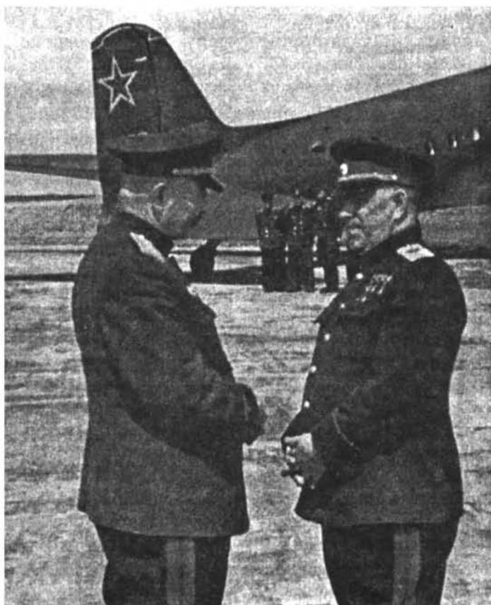
Մարշալ ժողովրդի հետ. 1945 թ. С маршалом Жуковым, 1945 г. With marshal Zhukov, 1945

гой техники. Противник не только не сумел перебросить с этого участка фронта вспомогательные силы на юг—к Сталинграду, где разгорелась одна из крупнейших и решительных битв Второй мировой войны, но и