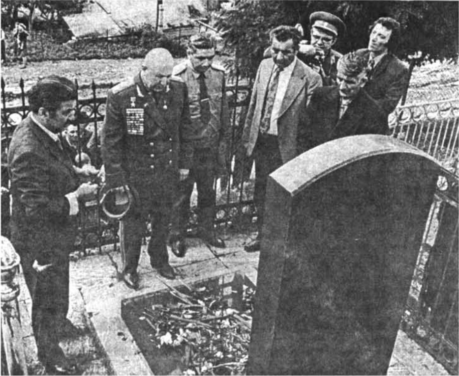
Հարազատների գերեզմանի մոտ, 1975 թ.

Այստեղ հարկ է հիշել, թե պատմա- կան Ղարաբաղի այդպիսի արհիության և անձնուրապության ընդունակ մի բուռ համառ ու դիմացկուն ժողովուրդը որ-