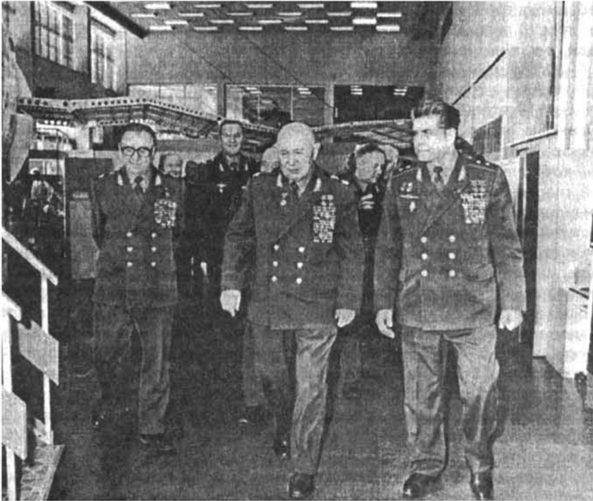
Մանրթութիւն տիեզերական տեխնիկային Ջվզղղի քաղաքում Ознакомление с космической техникой в Звездном городке Acquaintance with the space equipment in the Zvyozdny Gorodok

форович Баграмян отмечает, что дискуссия настолько привлекла внимание широчайших кругов общест-венности, что многотысячный коллектив французского телевидения даже нашел нужным временно пре-