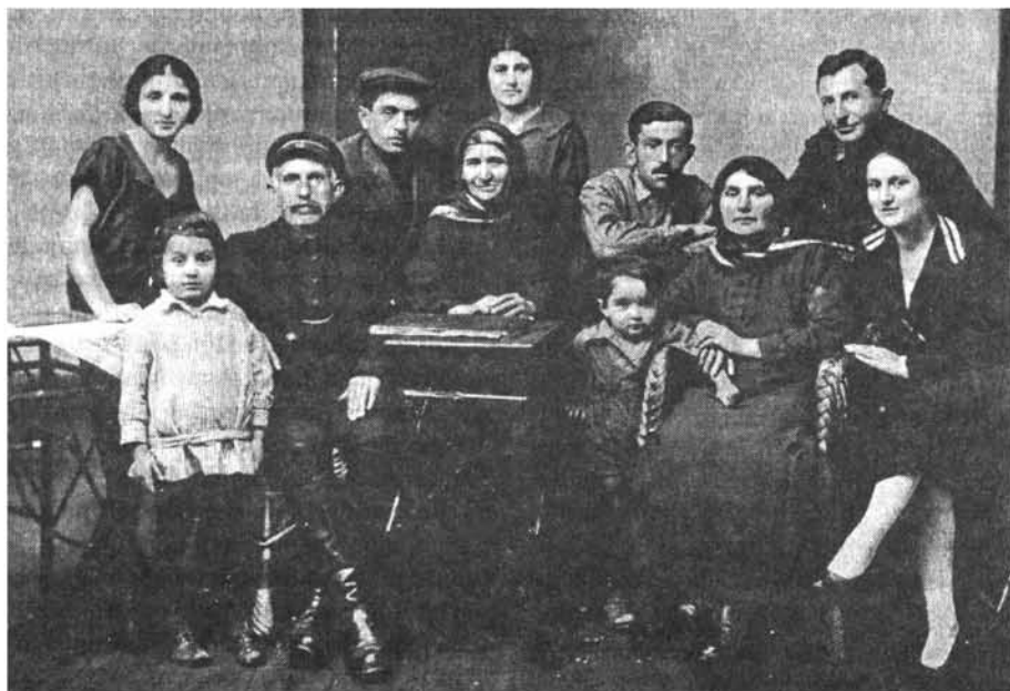
Բաղրամյանների ընտանիքը (հեղինակի ընտանեկան արխիվից) Семья Баграмянов (из семейного архива автора) Bagramians' family (from the family archive of author)