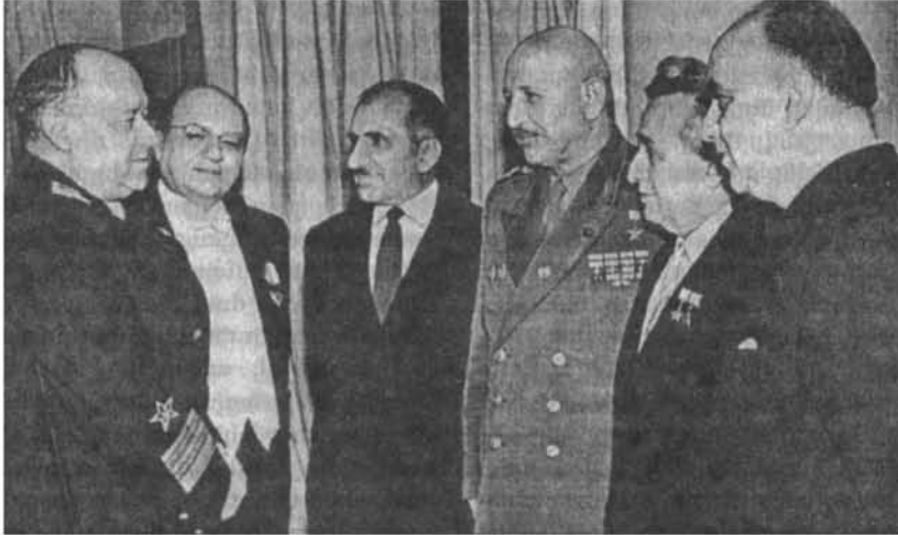
Չախից աջ. ԽՍՀՄ նավատորմի ադմիրալ Հ. Ս. Իսակով, ԽՍՀՄ ժողովրդական արտիստ Ա. Շ. Մելիք-Փաշայան, Սոցիալիստական աշխատանքի հերոս, պրոֆեսոր Ա. Յ. Աբրահամյան, ԽՍՀՄ մարշալ Հ. Բ. Բաղդամյան, ավիակոնստրուկտոր Ա. Ի. Միկոյան, ԽՍՀՄ ժողովրդական արտիստ Պ. Գ. Լիսիցյան

Այն ցույց տվեցի մարշալին: Նա հավանություն տվեց կոչի բովանդակությանը: Ես ասացի, որ եթե Ղարաբաղի հարցին չտրվի արդարացի լուծում ըստ ազգերի ինքնորոշման և մարդու իրավունքների սկզբունքների, ապա իրադարձություն-