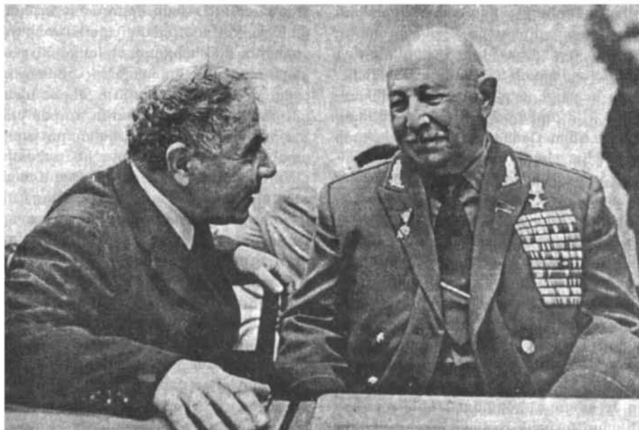
Հայաստանի գիտությունների ակադեմիայի նախագահ Վիկտոր Համբարձումյանի հետ С президентом Академии наук Армении Виктором Амбарцумяном With Viktor Hambartsumian—the President of the Academy of Sciences of Armenia

Բանավեճի ժամանակ գործը հասավ նրան, որ որոշ մասնակիցներ սկսեցին պրպարտել համաշխարհային հռչակ վալյելոլ այնպիսի մի պորավարի, ինչպիսին