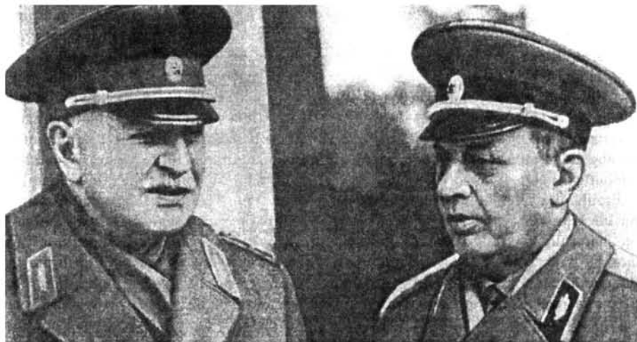
Երկու մարշալ նույն գյուղից՝ Հ. Բաղրամյան և Հ. Բաբաջանյան Два маршала из одного села: И. Баграмян и А. Бабаджанян Two marshals from the same village: H. Bagramyan and H. Babajanyan

գեներալ Վ. Վ. Կուրասովի վկայությամբ, Բաղրամյանը միշտ մտահոգված էր լինում, որ մարտերում աչքի ընկած զինվորները պարգևատրվեն ժամանակին: Ուշապման դեպքում անողոր էր: Շատ հաճախ ինքն էր գնում հոսպիտալները