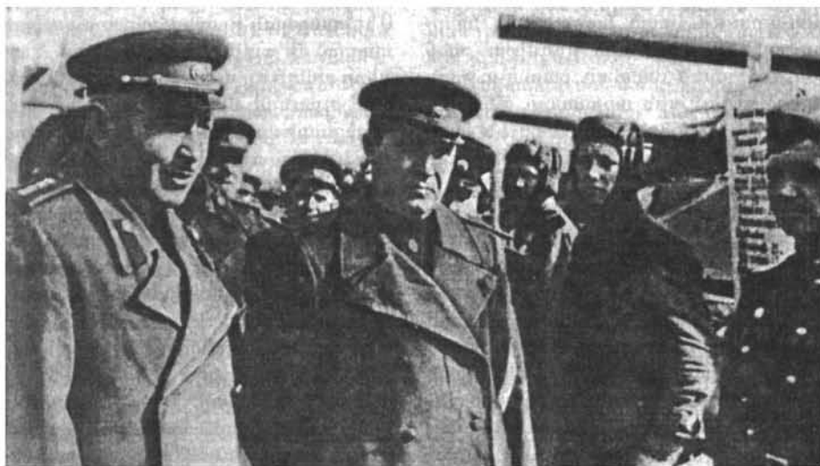
Հ. Բ. Բաղրամյանը ռազմաճակատի տանկիստների հետ О. Х. Баграмян среди танкистов фронта H. Ch. Bagramyan with the tankists of the Front

ձնռանը Ժիզդրայի ուղղությունում նոր հարձակման ժամանակ: Դրա հետևանքով հակառակորդը ստիպված է լինում հեռանալ Ռժև—Վյազմայի հենակետից, որի շնորհիվ իսպառ ջքանում է Մոսկվայի ուղղությամբ նրա հարձակման վտանգը: Ժիզդրայի ուղղությունում բանակի