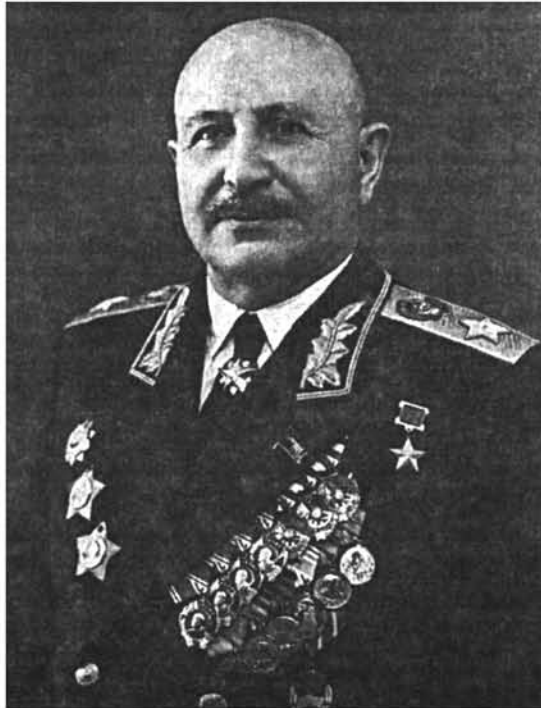
Խորհրդային Միության մարշալ Հ. Բաղրամյան. 1965 թ. Маршал Советского Союза О. Баграмян, 1965 г. Marshal of the Soviet Union H. Bagramyan, 1965

Եվ հիրավի, Սարդարապատի, Բաշ-Ապարանի, Ղարաքիլիսայի ճակատամարտերը բախտորոշ նշանակություն ունեցան հայ ժողովրդի համար. 1918 թ.