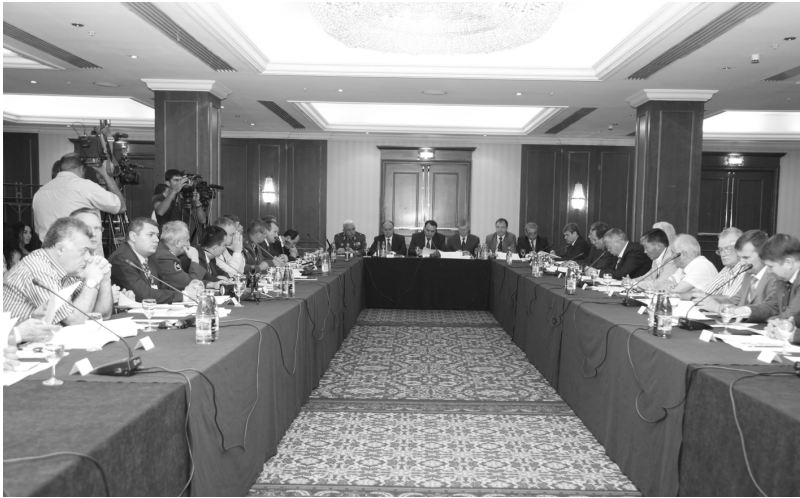
Общий вид церемонии открытия