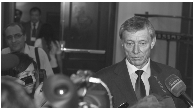
Интервью Генерального секретаря Организации Договора о коллективной безопасности Николая Бордюжи армянским журналистам