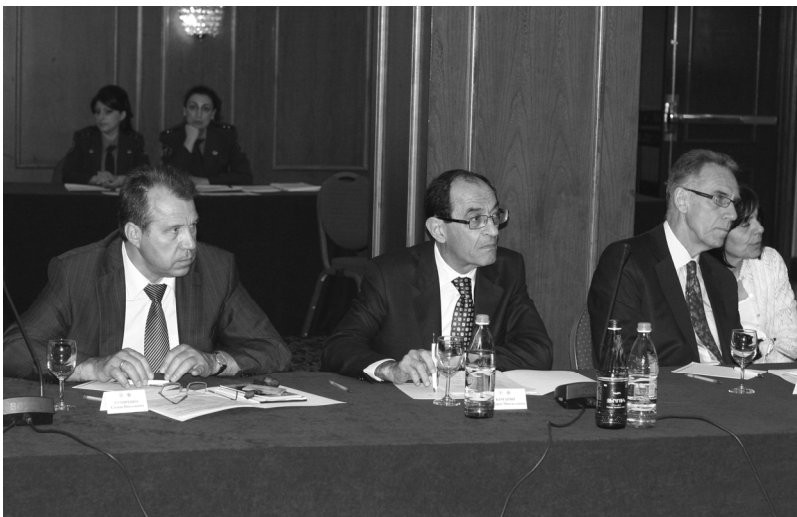
Слева направо: Степан Сухоренко, Чрезвычайный и Полномочный Посол Республики Беларусь в Республике Армения; Шаварш Кочарян, заместитель Министра иностранных дел РА; Анри Рено, Чрезвычайный и Полномочный Посол Французской Республики в Республике Армения