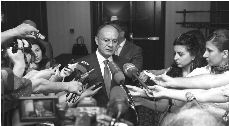
Интервью армянским журналистам Министра обороны РА Сейрана Оганяна