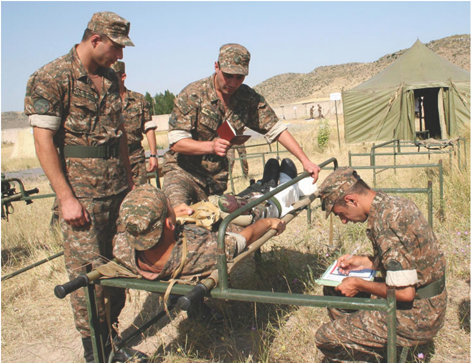
Դրվագ մարտադաշտում վիրավորներին բուժօգնության ցուցաբերման պարապմունքից