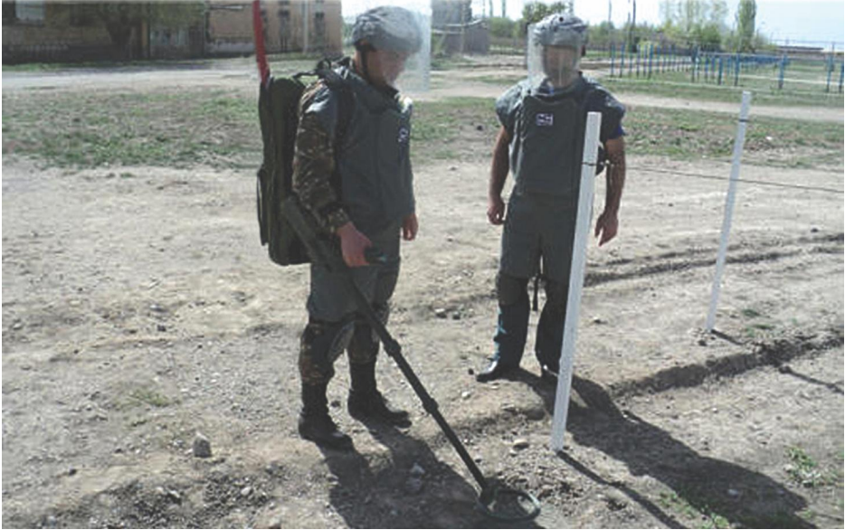
Դրվագ ՀՀ ՊՆ խաղաղապահ ինժեներական գումարտակում ԱՄՆ-ի Կանզասի ազգային գվարդիայի հրահանգիչների անցկացրած ականազերծման պարապմունքից