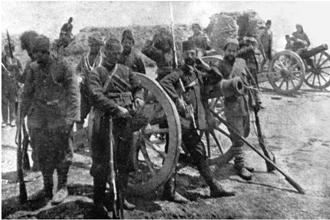
Հայ ինքնապաշտպանները թուրքերից գրաված թնդանոթներով. 1915 թ.

Եվ այսպես. Վանի հայ հասարակական-քաղաքական շրջանները, մասնավորապես՝ Դաշնակցությունը, որը 1914 թ. օգոստոսին էր գրումում ընդհանուր ժողով էր գումարել և հայտարարել օսմանյան (թուրքական) պետության նկատմամբ իր հավատարմության մասին, ոչ միայն դեմ էին անգամ ամենափոքր ապստամբական շարժում հրահրելուն և պաշտոնապես կամավորական զնդեր կազմավորելուն, այլև հայությանը խրախուսում էին կատարելու հայրենիքի նկատմամբ իր ունեցած քաղաքացիական պարտքը: