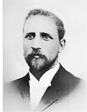
Քլարենս Աշերը (1870 – 1955)

Մինչդեռ թուրքերը համոզված էին, որ «քրիստոնյաներին պետք է կոտորել» 24 : Այսպես. Ջևհետը հայերի ու թուրքերի միջև միջնորդ Իտալիայի փոխ-հյուպատոս Սպորդոնին և ամերիկացի միսիոներ Աշերին հասցեագրված նամակում նշել է. «Ըստք հայերուն, թող չկարծեն թէ չենք գիտեր. Թիւրքիոյ հանդէպ իրենց թշնամական դիրքը գաղտնիք մը չէ մեզի համար: ...Թող լաւ գիտնան հայերը, երբ ջարդ սկսի հայերու՝ նախորդին նման չպիտի լինի բնաւ: Այս անգամ կիներուն ու երեխաներուն ալ չպիտի խնայենք: Այս երկիրը կամ միւսիլմաններուն պիտի ըլլայ բոլորովին, կամ քրիստոնիաներուն» 25 :