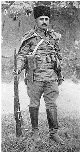
Արմենակ Եկարյանը (1870 – 1925)

խոստացան դիմել կառավարությանը, որ նա ընդհարման տեղիք չտա: Երբ Անդրանիկի գլխավորած 1-ին կամավորական ջոկատը պատերազմի սկզբին գրավեց թուրք-պարսկական սահմանին՝ Վանից ոչ հեռու, գտնվող Սարայ գյուղաքաղաքը, Վանում իշխանությունները խուճապի մատնվեցին և պատրաստվեցին տեղափոխվել Բիթլիս: Այդ օրերին Վանում թուրքական