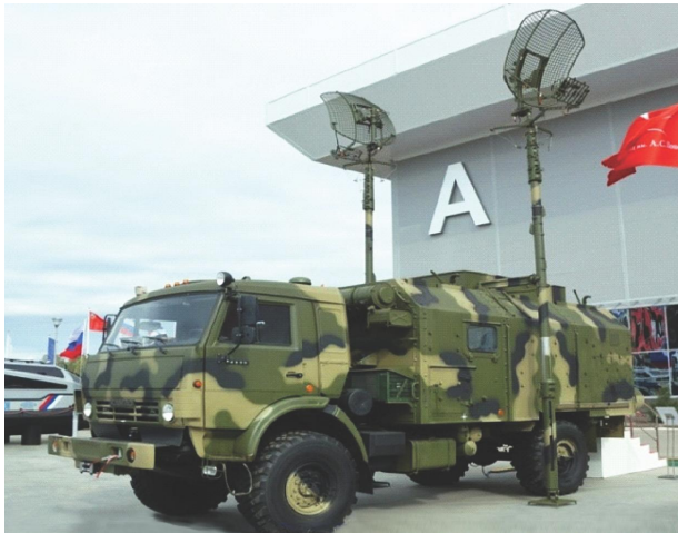
ՌԴ թվային Ռ-419L1 ռադիոռելեային կայան ( http://bastion-karpenko.ru/station-r-41911/ )