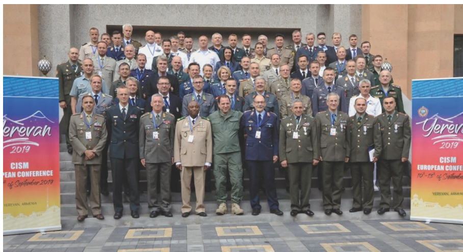
ՀՀ Պաշտպանության նախարար Դավիթ Տոնոյանը մասնակցել է Ռազմական սպորտի միջազգային խորհրդի համաժողովին Երևան, 2019 թ. սեպտեմբերի 11