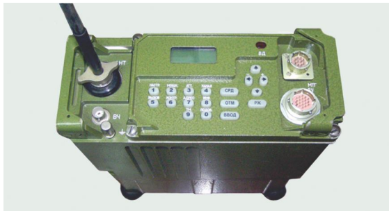
ԿԱ-տիրույթի ռուսաստանյան Ռ-168-5ԿՆԵ կրովի ռադիոկապյան ( http://www.sozvezdie.ru/ catalog/nosimaya_radiostantsiya_r1685kne )