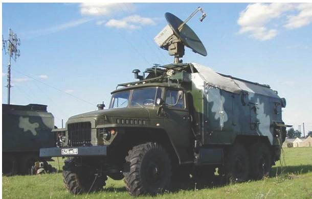
Արբանյակային կապի ռուսաստանյան Ռ-440 «Կրիստալ» կայան ( https://www.arms-expo.ru/news/meropriyatiya/na-vystavke-interpolitekh-2016 )