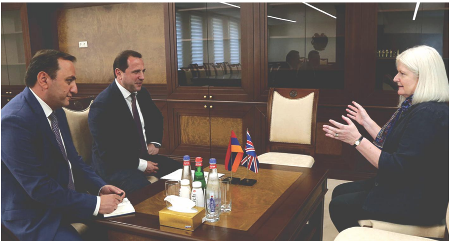
ՀՀ Պաշտպանության նախարար Դավիթ Տոնոյանն ընդունել է ՀՀ-ում Միացյալ Թագավորության արտակարգ և լիազոր դեսպան Ն. Գ. Զուդիտ Ֆառնուորտին՝ Հայաստանում նրա առաքելության ավարտի կապակցությամբ Երևան, 2019 թ. սեպտեմբերի 6