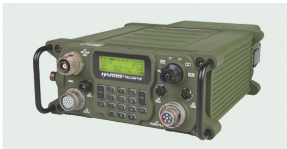
«Հարիս» ՌՖ-7800Հ-ՄՓ ամերիկյան ռադիոկապյան ( https://www.satellitetoday.com/government-military/2014/ 03/20/harris-corporation-introduces-new-hf-tactical-radio/ )