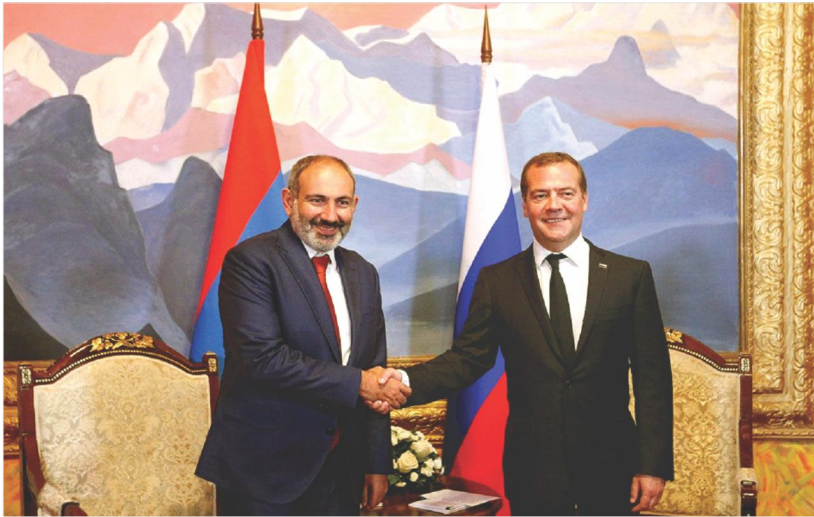
Հայաստանի Հանրապետության Վարչապետ Նիկոլ Փաշինյանի և Ռուսաստանի Դաշնության Կառավարության Նախագահ Դմիտրի Մեդվեդևի հանդիպումը Եվրասիական միջկառավարական խորհրդի նիստի շրջանակներում Չոլպոն-Ատա, 2019 թ. օգոստոսի 9