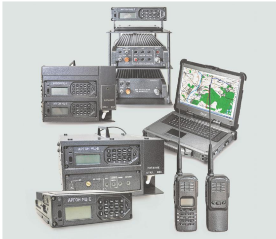
Ռադիոկապի ռուսաստանյան «Արգոն-Է» համալիր ( http://elektrosignal.ru/wp-content/ uploads/2018/06/Argon-E%60.pdf )