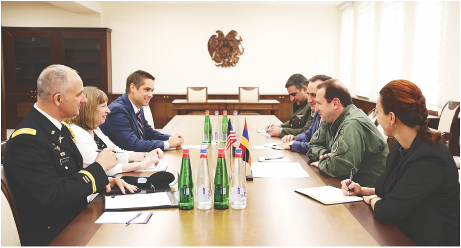
ՀՀ Պաշտպանության նախարար Դավիթ Տոնոյանն ընդունել է ՀՀ-ում ԱՄՆ-ի արտակարգ և լիազոր դեսպան Ն.Գ. տիկին Լին Թրեյսիին, ՀՀ-ում ԱՄՆ-ի դեսպանությունում առաքելության ղեկավարի նորանշանակ տեղակալ Քրիստոֆեր Սմիթին և նորանշանակ ռազմական կցորդ գնդապետ Սկոտ Մաքսվելին Երևան, 2019 թ. սեպտեմբերի 10