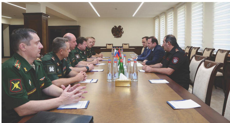
ՀՀ Պաշտպանության նախարար Դավիթ Տոնոյանն ընդունել է Ռուսաստանի Դաշնության պաշտպանության նախարարության զինվորական ոստիկանության գլխավոր վարչության պետի տեղակալ գեներալ-մայոր Վիտալի Կոխի գլխավորած պատվիրակությանը Երևան, 2019 թ. օգոստոսի 29