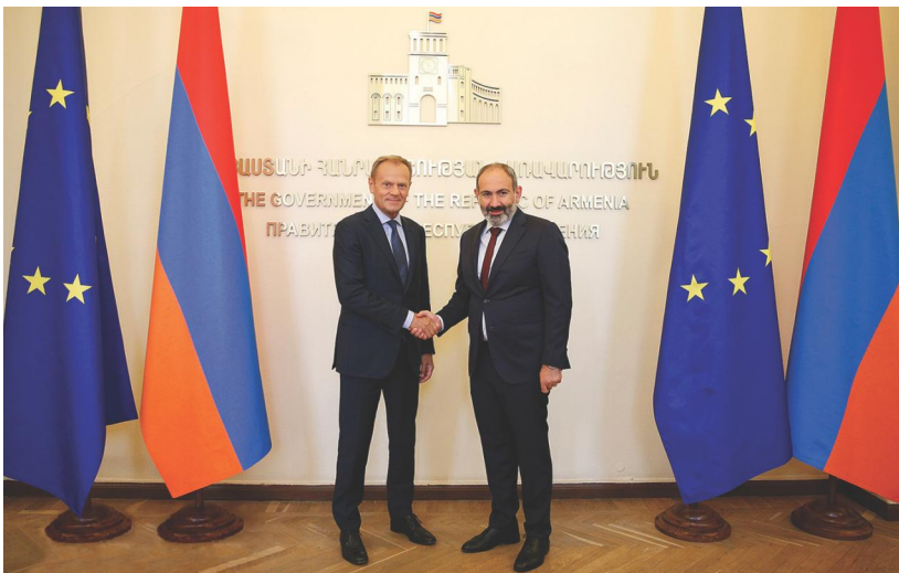
Եվրոպական խորհրդի Նախագահ Դոնալդ Տուսկի և Հայաստանի Հանրապետության Վարչապետ Նիկոլ Փաշինյանի հանդիպումը Երևան, 2019 թ. հուլիսի 10