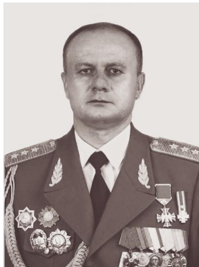
Քյոսալարի (հյուսիսարևմտյան) ուղղության հրամանատար, Արցախի հերոս, գեներալ-գնդապետ Սեյրան Օհանյան