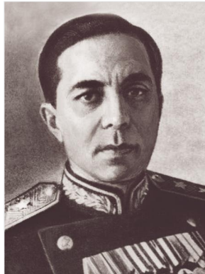
Գերմանիայում խորհրդային ռազմաճակատի քաղվարչության պետ, գեներալ-լեյտենանտ Սերգեյ Գալաջև