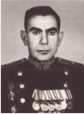
89-րդ Հայկական Թամանյան դիվիզիայի հրամանատար (1942–1946 թթ.), գեներալ-մայոր Նվեր Սաֆարյան