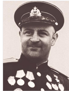
Գրոհային ավիագնդի հրամանատար, ԽՍ կրկնակի հերոս (հայերից առաջինը), գվարդիայի փոխգնդապետ Նելսոն Ստեփանյան