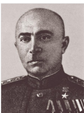
Ռազմաճակատի հրետանու հրամանատար, ԽՄ Խերոս, գեներալ-լեյտենանտ (գեներալ-գնդապետ) Միքայել Պարսեղով