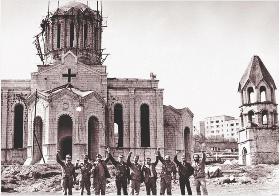
Մի խումբ ազատամարտիկներ Շուշիի Սուրբ Ամենափրկիչ Ղազանչեցոց եկեղեցու մոտ