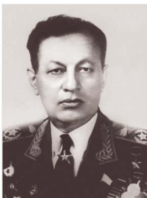
Գվարդիական տանկային կորպուսի հրամանատար, ԽՄ Խերոս, գեներալ-մայոր (գրահատանկային զորքերի գլխավոր մարշալ) Համազասպ Բաբաջանյան