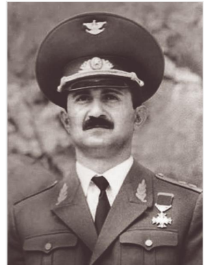
Լաչինի (հարավային) ուղղության հրամանատար, Արցախի հերոս, գեներալ-լեյտենանտ Սամվել Բաբայան