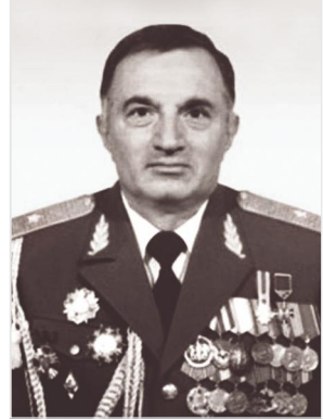
Շուշիի ազատագրման օպերացիայի ղեկավար, ԻՊՈՒ-ի հրամանատար, Արցախի հերոս, գեներալ-մայոր Արկաղի Տեր-Թադևոսյան