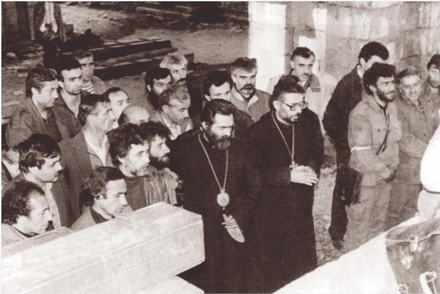
Արցախի թեմի առաջնորդ Պարզև արքեպիսկոպոս Մարտիրոսյանի և ազատամարտիկների համատեղ աղոթքը Շուշի քաղաքի ազատագրման կապակցությամբ Շուշի, Սուրբ Ամենափրկիչ Ղազանչեցոց եկեղեցի, 1992 թ. մայիսի 9