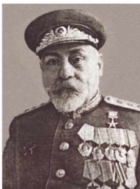
ԽՍՀՄ ԳԱ փոխնախագահ, ԽՍՀՄ ռազմաթշկական ակադեմիայի պետ, Սոց. աշխ. Խերոս, ք/ծ գեներալ-գնդապետ Լևոն Օրբելի