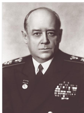
ՌԾՈՒ-ի Գլխավոր շտաբի պետ, ՌԾՈՒ-ի ժողկոմի առաջին տեղակալ, ԽՄ Խերոս, Նավատորմի ծովակալ (ԽՄ նավատորմի ծովակալ) Հովհաննես Իսակով