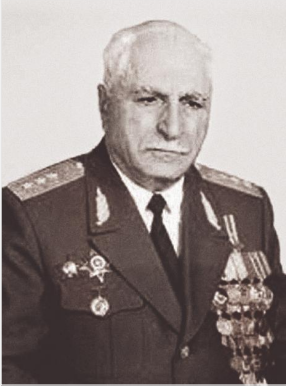
Շուշիի ազատագրման օպերացիայի պլանի համահեղինակ, «Մարտական խաչ» 1-ին աստիճանի շքանշանակիր, գեներալ-գնդապետ Գուրգեն Դալիբալթայան