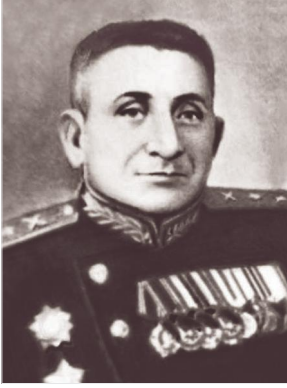
Կարմիր բանակի հրետանու մարտական պատրաստման վարչության պետ, հրետանու գեներալ-լեյտենանտ Իվան Վեքիլով