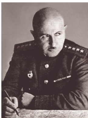
Ռազմաճակատի հրամանատար, ԽՄ Խերոս (կրկնակի), բանակի գեներալ (ԽՄ մարշալ) Հովհաննես Բաղդամյան