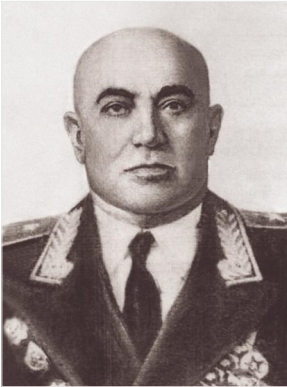
Բանակի շտաբի պետ, գեներալ-լեյտենանտ Ստեփան Գինոսյան