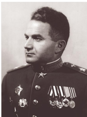
ՌՕՈՒ-ի շտաբի պետ, ՌՕՈՒ-ի հրամանատարի տեղակալ, ավիացիայի մարշալ Արմենակ Խանփերյանց