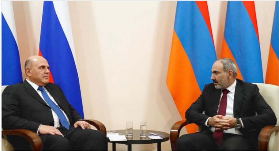
Հայաստանի Հանրապետության Վարչապետ Նիկոլ Փաշինյանի և Ռուսաստանի Դաշնության կառավարության նախագահ Միխայիլ Միշտուկովինի հանդիպումը Եվրասիական միջկառավարական խորհրդի նիստի շրջանակներում Երևան, 2020 թ. հոկտեմբերի 9