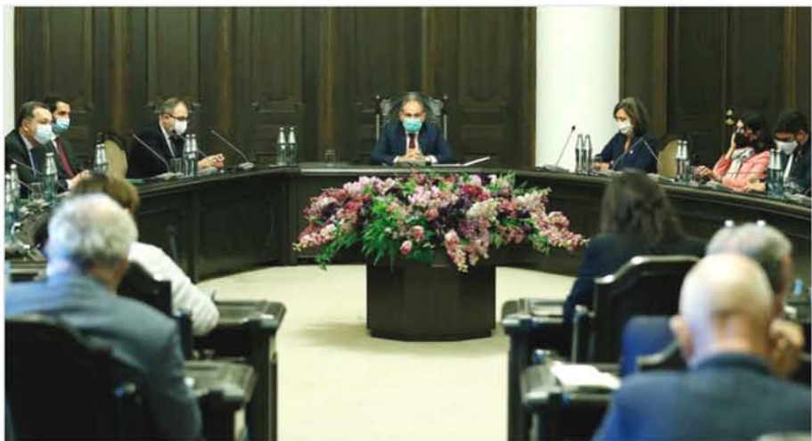
Հայաստանի Հանրապետության Վարչապետ Նիկոլ Փաշինյանի հանդիպումը Ֆրանսիայի Հանրապետության խորհրդարանի պատգամավորական պատվիրակության հետ Երևան, 2020 թ. հոկտեմբերի 25