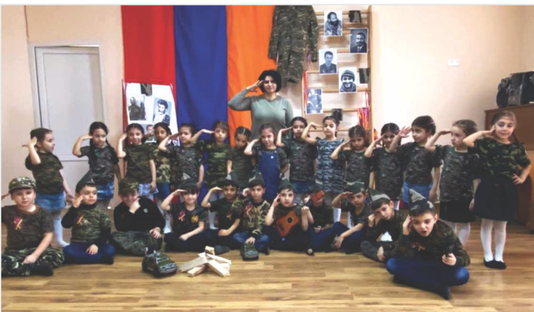
Ռազմահայրենասիրական դաստիարակության միջոցառում Երևանի նախադպրոցական հաստատություններից մեկում