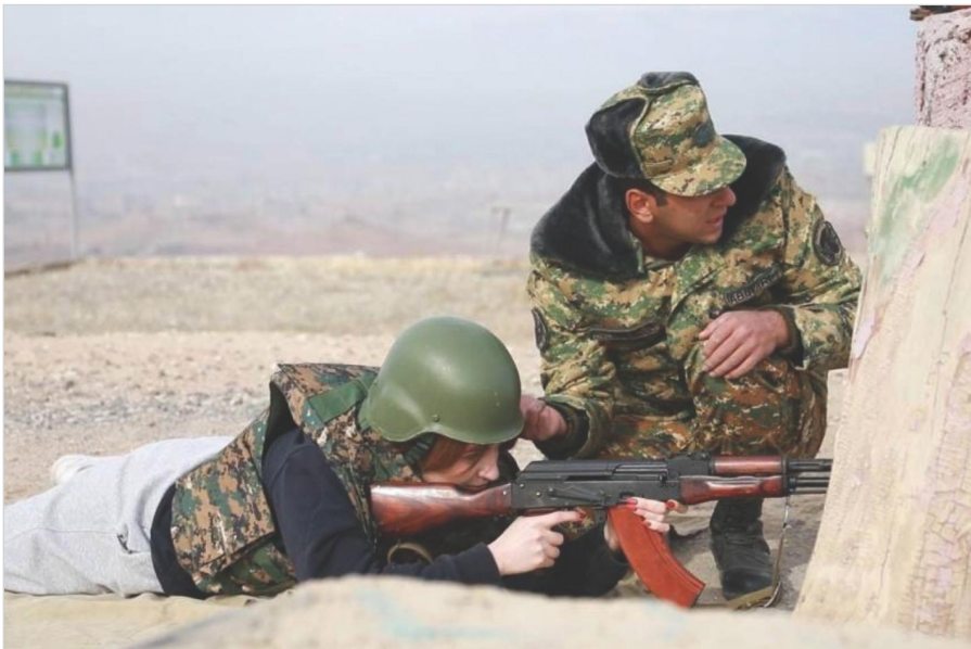
Դրվագ քաղաքացիական անձանց համար ՀՀ ՊՆ կազմակերպած հրաձգության դասընթացից 2022 թ. նոյեմբերի 5