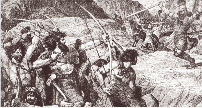
Հայկ և Բել («Հին հայկական վիպասանքից և առասպելներից» ալբոմից: Ե., 1939 թ.): Նկարիչ՝ Յոզեֆ Ռոտտեր