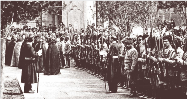
Ամենայն Հայոց Կաթողիկոս Գևորգ Ե Սուրենյանցը օրհնում է կամավորներին Սբ. Էջմիածնի Մայր տաճարի առջև, 1914 թ.