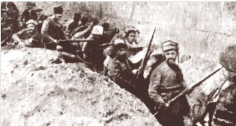
Դրվագ Վանի ինքնապաշտպանական մարտերից, 1915 թ.