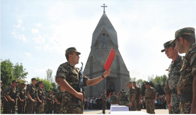
Դրվագ երդման արարողությունից «Եռաբլուր» պանթեոնում