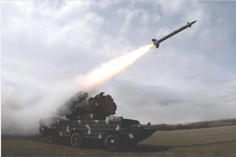
Հրաձգություն հակաօդային պաշտպանության 9433 «Օսա-ԱԿՄ» զենիթահրթիռային համալիրով