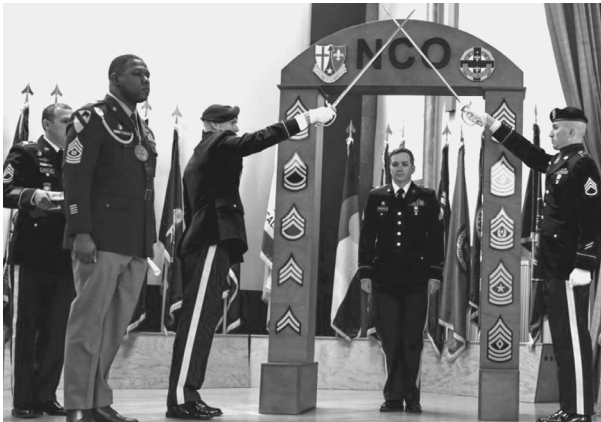
Սերժանտի կոչում շնորհելու արարողությունը* [16] Noncommissioned Officer Induction Ceremony [16]

Սերժանտական կազմի այս պարտավորությունը [18, էջ viii], որ նոր առաջ քաշված զինվորն ստորագրում է մնացած բոլոր զինվորների ներկայությամբ, ծառայում է որպես ֆիզիկական գործողություն, որը զինծառայողն ընտրում է հոժարակամորեն: Այս նորընծա սերժանտը, գիտակցելով իրենից պահանջվող անմնացորդ անձնուրացությունը և լրացուցիչ պատասխանատվությունը, որը հարկ կլինի ստանձնել, կամովին ստորագրում է «Սերժանտի պարտավորությունները», որպեսզի օգնի, որ Բանակն ու պետությունն