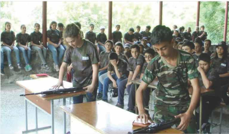
Դրվագ նախնական զինվորական պատրաստման դասընթացի հանրապետական օլիմպիադայից